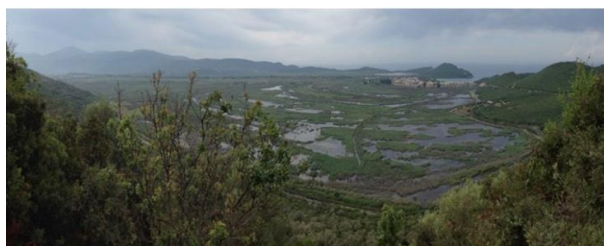
Εικόνα 7-1. Πανοραμική φωτογραφία της ευρύτερης περιοχής της Σαγιάδας όπου συγκεντρώνονται αποθέσεις πηλών.