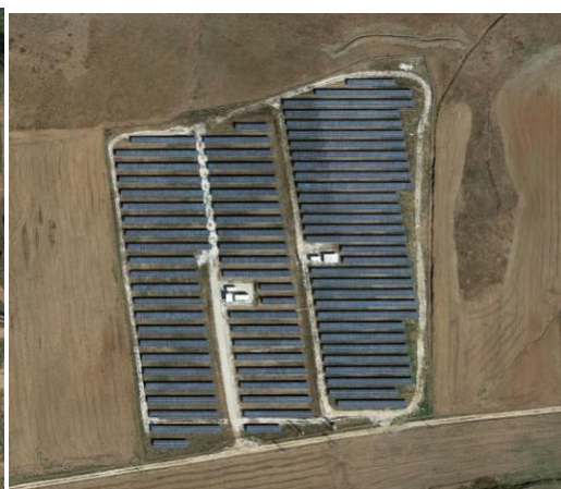
Περιπτώσεις μη επιλέξιμων στοιχείων: 1) Γήπεδο ποδοσφαίρου 2) Συγκοινωνιακό δίκτυο 3) Κτιριακές εγκαταστάσεις 4) Α.Π.Ε